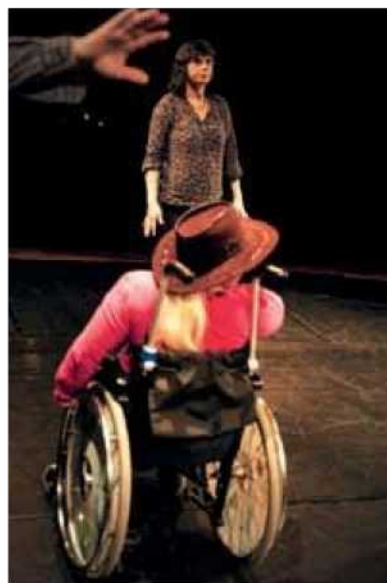
Každý jednotlivý pohyb tanečnicka na vozíku je promyšlený a zapadá do celkové koncepce.

Ona sama raději mluví o spoluúčasti svých tanečnic. „To oni navrhli náš název, také otazník na konci názvu mi přijde případný a správný. Říkávám: Děcka, přineste muziku, skladbu, která se vám moc líbila! Letos tančíme na jednu píseň od zpě-